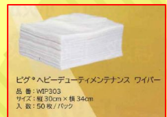
ピダ®ヘビーデューティメンテナンス ワイパー 品番: WIP303 サイズ: 縦 30cm x 横 34cm 入数: 50枚/パック

★キャンペーン実施中★ 2019年12月末日まで 1缶ご購入につき、頑固な 汚れの拭取りに便利で何 度も洗って使える高品質 ワイパーをプレゼント!!