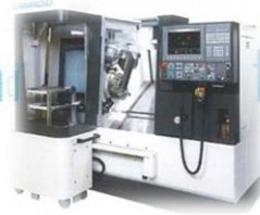
ターニングセンター+ビルトインロボット LB3000EX II ARMROID