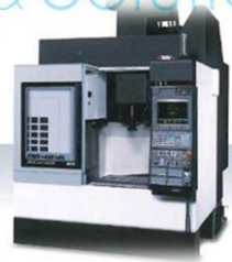
立形マシニングセンタ MB-46VA