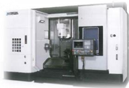
インテリジェント複合加工機 MULTUS U3000