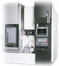
5軸制御立形マシニングセンタ MU-4000V-L