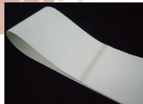
樹脂レーシング材質: ポリエステル

1プライベルト専用の特殊レーシングエンドレスです。特にベルトのエンドレスが困難な場所や、作業性が悪い場所でもピンを通すだけで容易にベルトの交換が出来ます。プラスチックレーシングの為、搬送物やコンベア設備などに傷つけることはありません。各コンベアメーカーのミニコン用ベルト(ブリー径25mm)に対応しています。